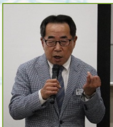
琉球大学名誉教授 牛窪 潔